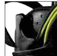
HAIX® Climate System