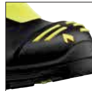
HAIX® High Durability Cap System