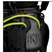
HAIX® RAPIDFIT System