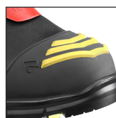
HAIX® High Durability Cap System