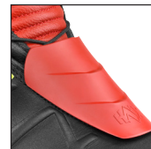
HAIX® 3Z Protector System