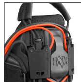
HAIX® RAPIDFIT System