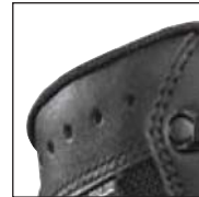
HAIX® Climate System